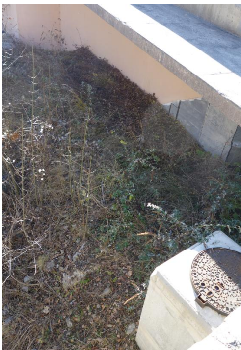
Illustration 5 : nombreux nouveaux buddléias en contrebas du pont Saint Antoine, à proximité de la zone où les 3 individus plantés étaient présents.