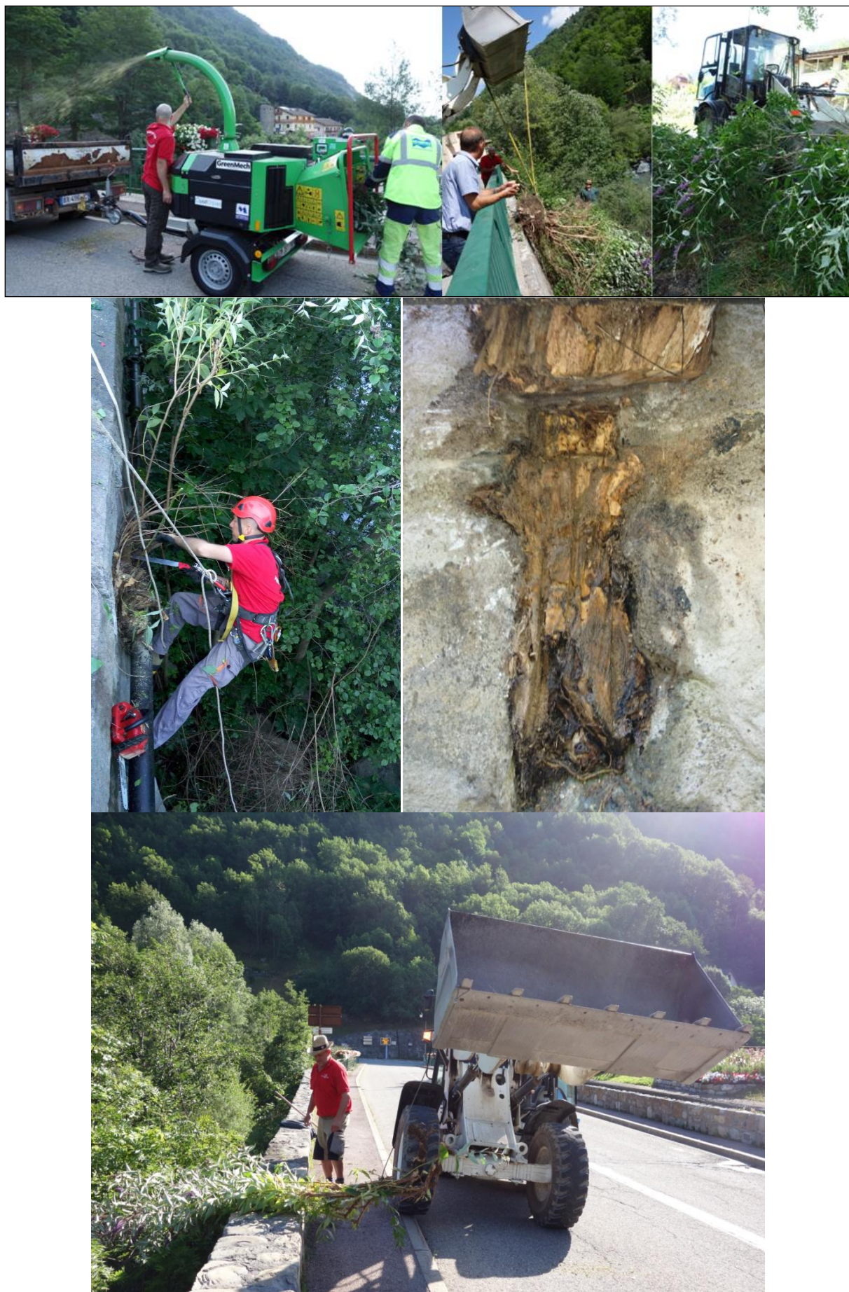
Illustration 2 : Opération d'élimination du Buddleia de David sur la commune de Saint-Etienne-de-Tinée en juillet 2016, au niveau du pont Saint Antoine (boulevard de la Digue). Le chantier a nécessité 4 jours d'intervention, avec 4 hommes.