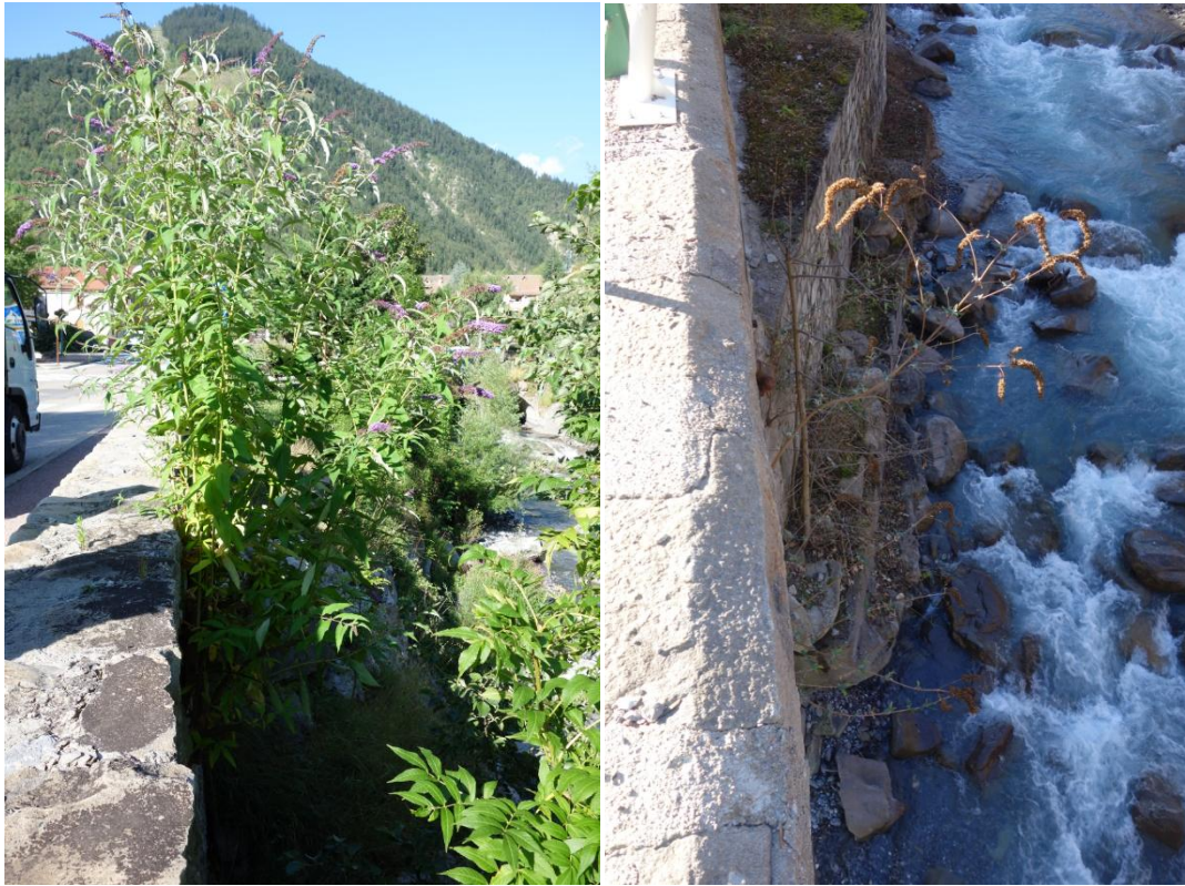
Illustration 6 : reprise faible de buddleia deux ans après le tronçonnage au niveau du Pont

Comparaison : à gauche 2016/ à droite 2018