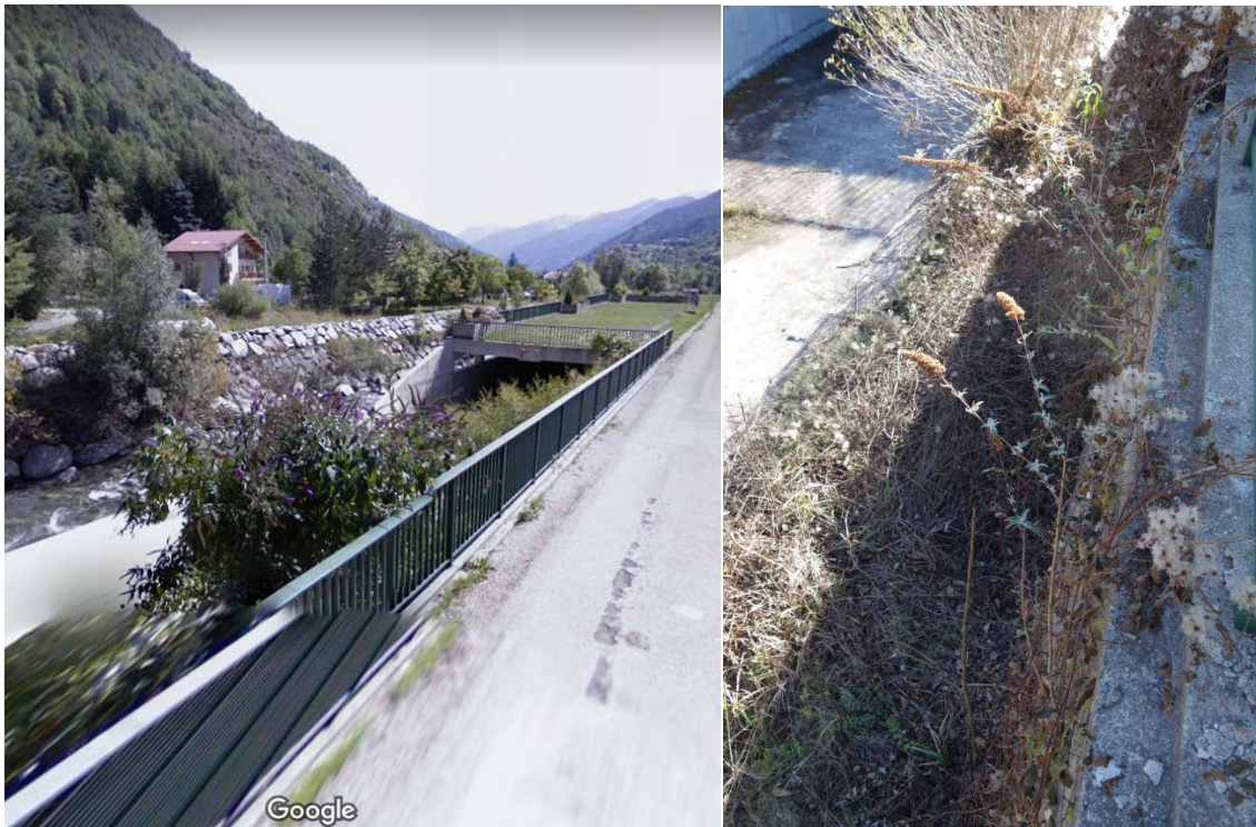
Illustration 7 : reprise faible de buddleia deux ans après l'arrachage sur le boulevard Napoléon III