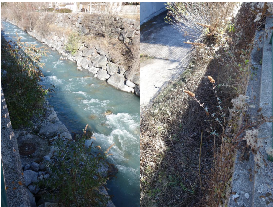
Illustration 4 : Reprise de buddléias sur le boulevard Napoléon III– Gauche : Individus avec une reprise importante en amont du parking – Droite : Reprise moins importante des individus qui ont été tronçonnés.