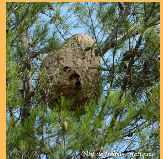
Nid de frelons asiatiques