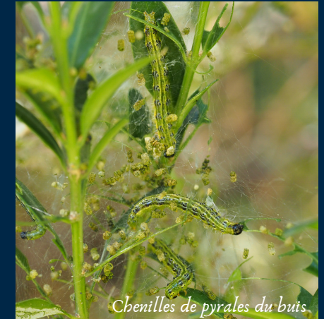
Chenilles de pyrales du buis

Ce phénomène peut également avoir des conséquences économiques ou sanitaires négatives.