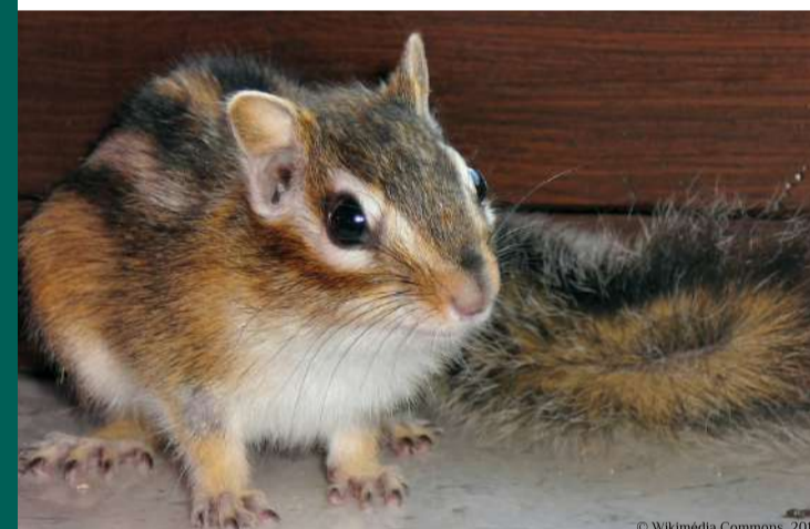
Une autre espèce exotique : le tamia de Sibérie Tamias sibiricus REE 13-07-2016 : préoccupation européenne ( T. sibiricus , S. niger et S. carolinensis ...) AM 30-07-2010 : interdite d'introduction AM 10-08-2004 : détention réglementée