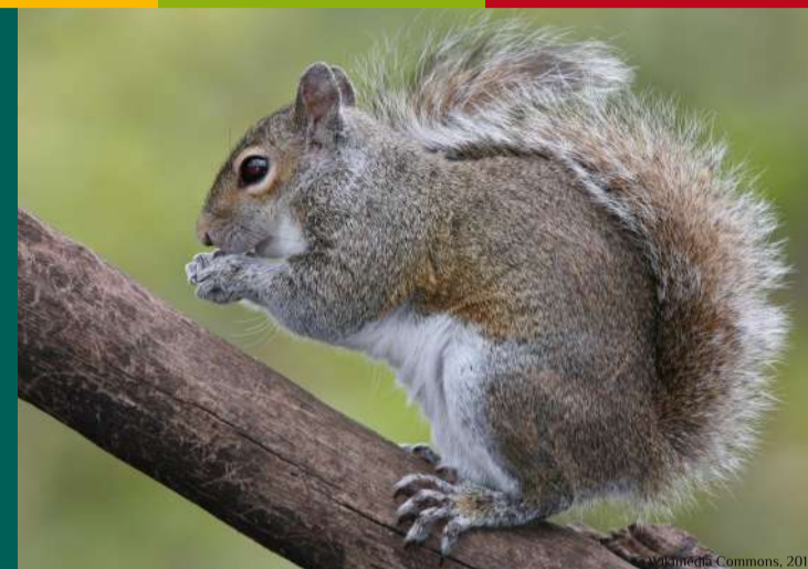
Exemple d'un écureuil exotique : l'écureuil gris Sciurus carolinensis