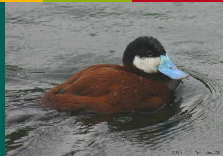
Érismature rousse mâle Oxyura jamaicensis en plumage nuptial