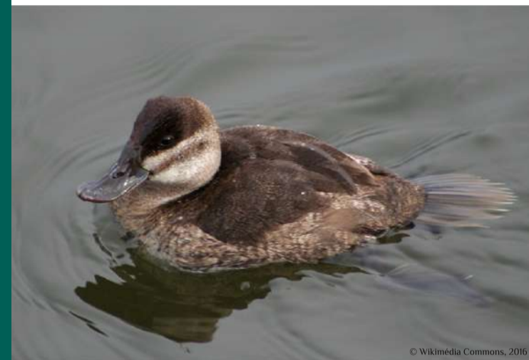
Individu femelle d'érismature rousse

REE 13-07-2016 : préoccupation européenne AM 30-07-2010 : interdite d'introduction AM 10-08-2004 : détention réglementée Arrêté de destruction national