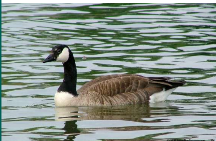
Bernache du Canada Branta canadensis en repos