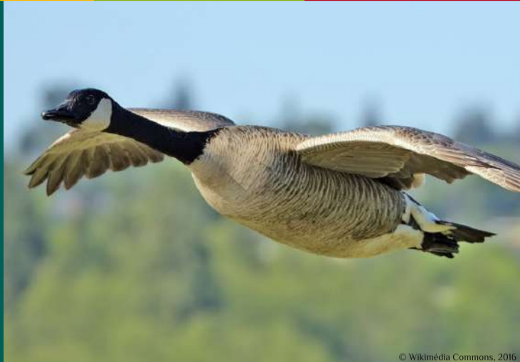
Bernache du Canada Branta canadensis en vol