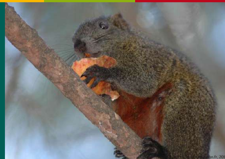
Écureuil de Pallas Callosciurus erythraeus à Antibes (06)