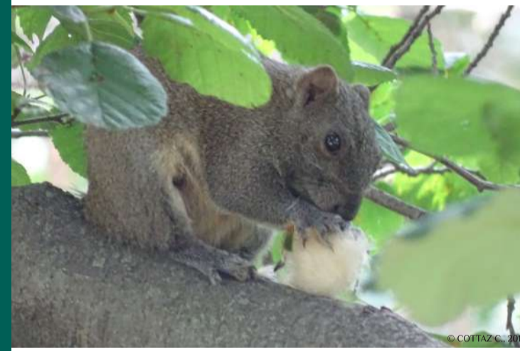
Écureuil de Pallas à Entressen (13), avec le ventre plus jaune

REE 13-07-2016 : préoccupation européenne AM 30-07-2010 : interdite d'introduction AM 10-08-2004 : détention réglementée Arrêtés de destruction dans le 06 et le 13.