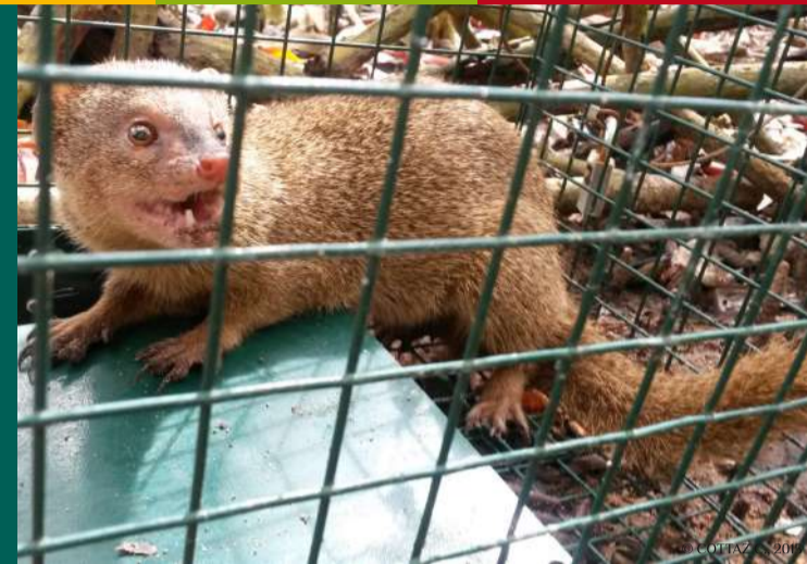
Petite mangouste indienne Urva auropunctata piégée

Existe-t'il un protocole spécifique ? À vérifier sur le serveur R:\Public\EEE