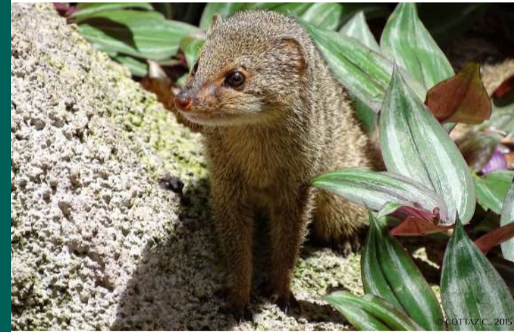
Une petite mangouste indienne Urva auropunctata

Quelles autres actions entreprendre ? Vérifier les zones de détention de l'espèce (zoos, etc.). Rappel : détention interdite par des particuliers.